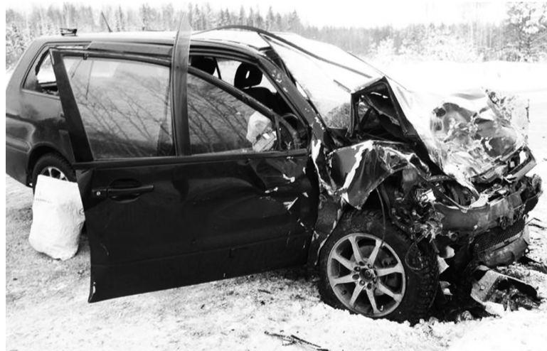
Авария на трассе

Одна из главных проблем, на которую нам рекомендовано обратить внимание – это выявление водителей, управляющих автотранспортными средствами в состоянии алкогольного опьянения. По итогам прошлого года из