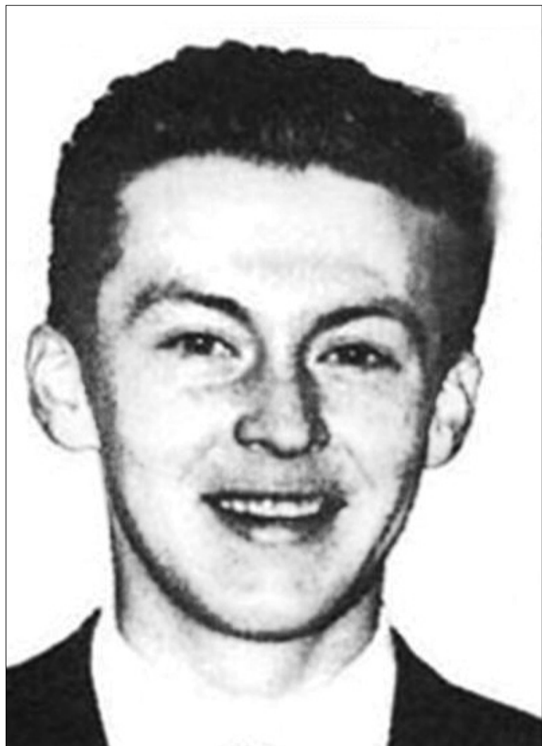
Юрий Игитов — Герой России

Ещё в Древней Греции Гомер заметил: «Людям надоедает спать, любить, петь и танцевать быстрее, чем воевать». Получается, что все ужасы воинов, все несчастья, принесённые кровопролитием, это просто чья-то забава? Возможно. Но вот что стоит за этим?